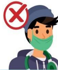
Embaixo do nariz